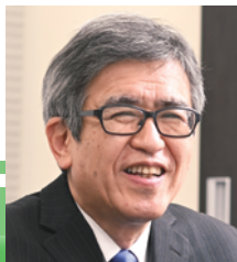
東京大学名誉教授 川上憲人先生登場!