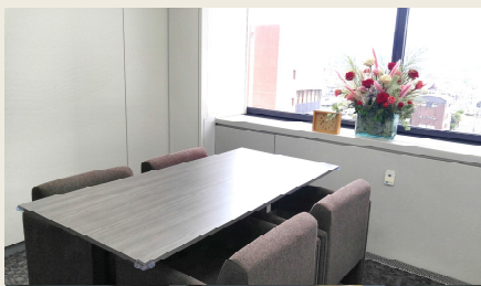
相談室からは大文字山、東山、一之船入など四季折々の風景を一望できます。

※ご相談内容がご本人の許可なく職場や第三者に漏れることはありません。どうぞ安心してご利用ください。