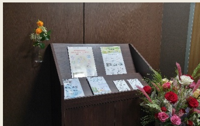
メンタルヘルス関連冊子リーフレット提供コーナー