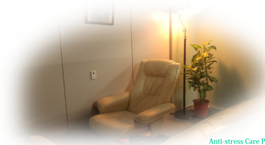
Anti-stress Care Program

ストレスや疲れが気になるけれども専門医の診断やカウンセリングを受けるのは抵抗がある方や、ストレスチェックやリラクゼーション、カウンセリングを体験してみたい、といった方に気軽にご利用いただけます。