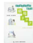
「メンタルヘル스에役立つ職場ドック」(共著) 2015.公益財団法人 大原記念労働科学研究所