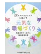
「ストレスチェックを活かす元気な職場づくり」 集団分析から始める職場環境改善」(事例執筆) 2017.中央労働災害防止協会