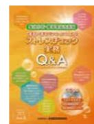
「集団分析・職場環境改善版 産業医・産業保健スタッフのためのストレスチェック実務Q&A」(共著) 2018.公益財団法人 産業医学振興財団