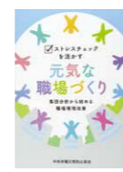
「ストレスチェックを活かす元気な職場づくり」 集団分析から始める職場環境改善」(事例執筆) 2017.中央労働災害防止協会