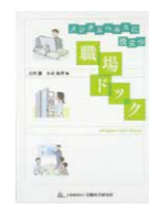
「メンタルヘルスに役立つ職場ドック」(共著) 2015.公益財団法人 大原記念労働科学研究所