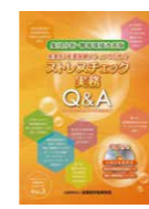
「集団分析・職場環境改善版 産業医・産業保健スタッフのためのストレスチェック実務Q&A」(共著) 2018.公益財団法人 産業医学振興財団